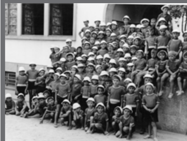
Grupo de crianças com enxoval para a época estival, na colónia de férias de Vila do Conde na década de 60.