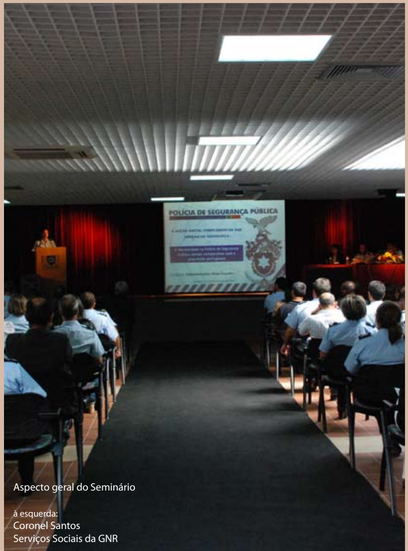
Aspecto geral do Seminário